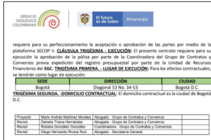
Imagen 2.

Rta: Aclaremos que el contrato que se adjuntó en la oferta es firmado digitalmente debido a que se genera por la plataforma del secop II. Adjunto enviamos acta de liquidación firmada por ambas partes donde podrán verificar la información del mismo. El proceso a través del cual se llevó a cabo la contratación es el No.428 y toda la documentación, y aceptación de condiciones puede ser verificada en la plataforma SECOP II en el siguiente link: